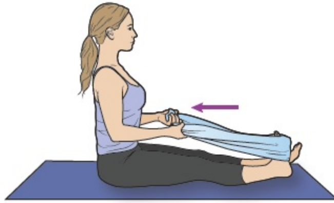
Figura 4. Estiramiento de pantorrilla