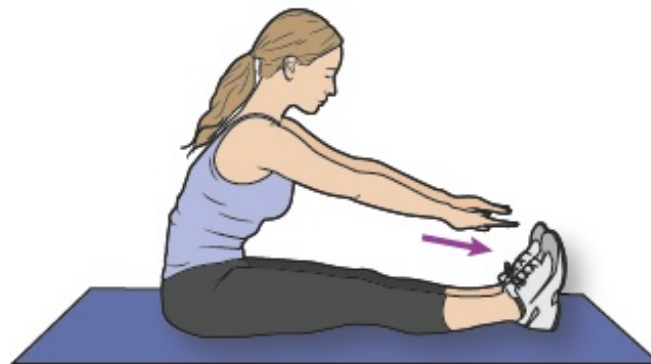
Figura 5. Estiramiento de ligamento de la corva