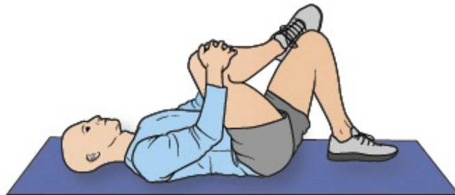
Figura 6. Estiramiento de cadera