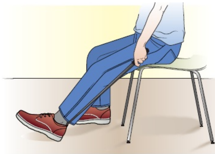
Figura 2. Use un calzador