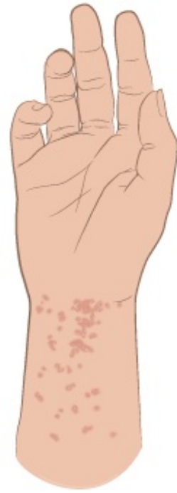
Figure 1. Sarpullido y surcos de la sarna

La picazón y el sarpullido pueden presentarse en cualquier parte del cuerpo, pero es más probable que aparezcan en o alrededor de las siguientes zonas (véase la figura 2):