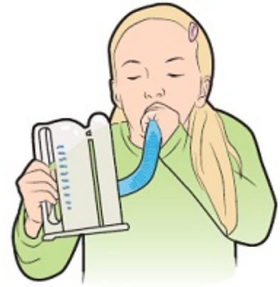
Figura 3. Uso de un espirómetro de incentivo

A veces, respirar profundamente puede ser doloroso después de la cirugía debido a las incisiones (cortes quirúrgicos) en el pecho o abdomen (vientre) del niño. Para ayudar a mejorar la respiración del niño, su enfermero y terapeuta practicarán ejercicios de respiración profunda con él. Para