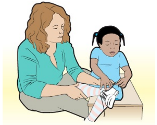
Figura 1. Trabajo con un OT