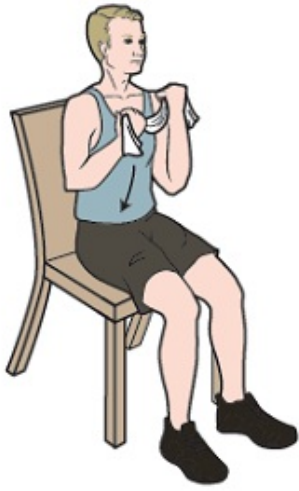
Figura 4. Sostenga la banda a la altura del mentón