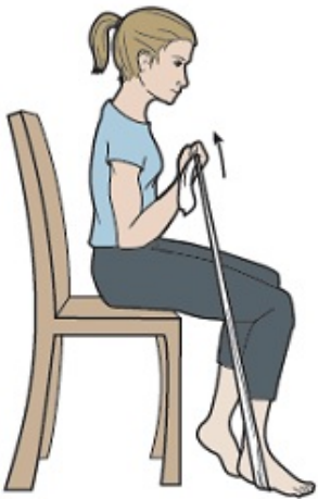
Figura 3. Tire de la banda hacia arriba.