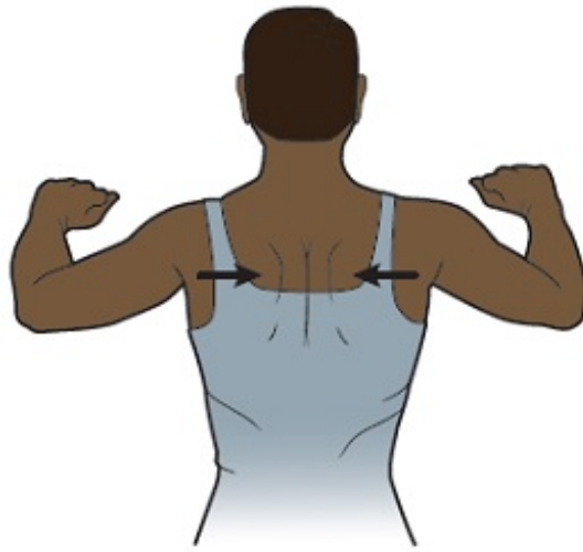
Figura 8. Apriete los omóplatos uno contra el otro