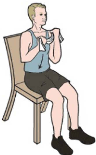
Figura 4. Sostenga la banda a la altura del mentón