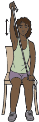
Figura 7. Tire de la banda por encima de la cabeza