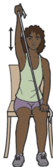
Figura 7. Tire de la banda por encima de la cabeza