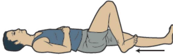
Figura 6. Deslizamiento de talón