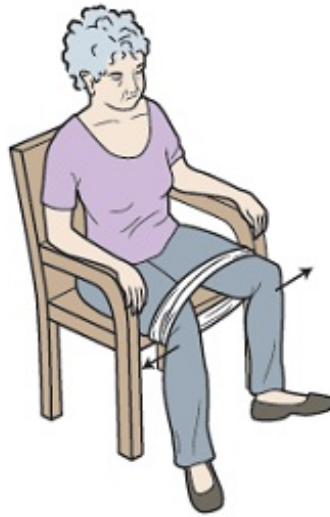
Figura 7. Fortalecimiento de los músculos abductores en posición sentada con banda elástica