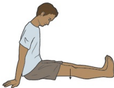
Figura 3. Series de cuádriceps