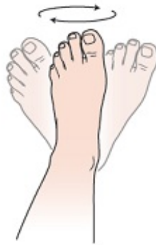
Figura 1. Círculos con los tobillos