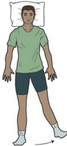
Figura 5. Ejercicio para el fortalecimiento de los músculos abductores