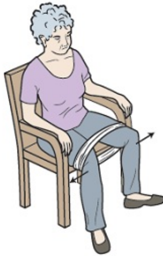
Figura 7. Fortalecimiento de los músculos abductores en posición sentada con banda elástica