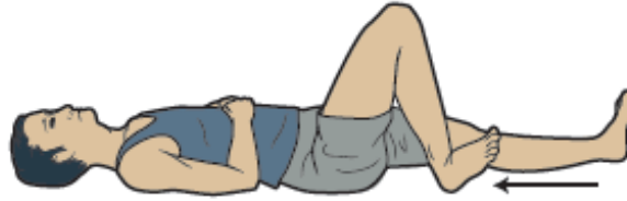
Figura 6. Deslizamiento de talón