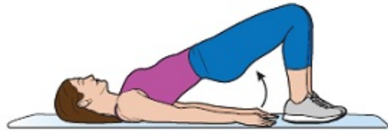
Figura 8. Levante las posaderas