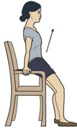
Figura 10. Levántese de la silla usando los apoyabrazos