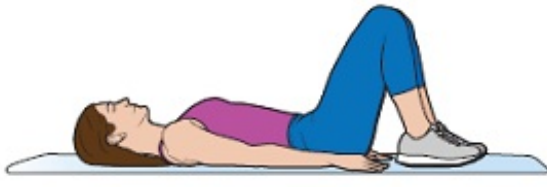
Figura 7. Acuéstese con la espalda recta y las rodillas dobladas