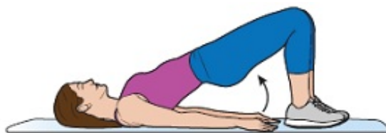
Figura 8. Levante las posaderas