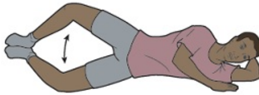
Figura 11. Ejercicio de la almeja

If you have questions or concerns, contact your healthcare provider. A member of your care team will answer Monday through Friday from 9 a.m. to 5 p.m. Outside those hours, you can leave a message or talk with another MSK provider. There is always a doctor or nurse on call. If you're not sure how to reach your healthcare provider, call 212-639-2000.