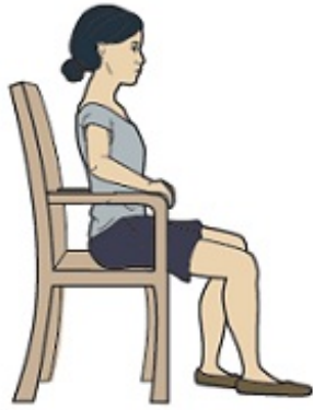
Figura 9. Siéntese con la espalda recta