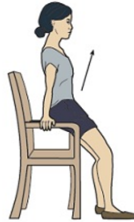
Figura 10. Levántese de la silla usando los apoyabrazos