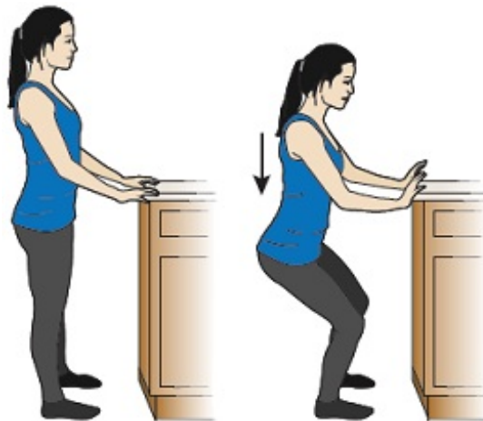
Figura 3. Minisentadillas