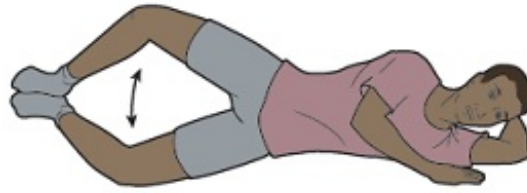
Figura 11. Ejercicio de la almeja

Si tiene preguntas, contacte a un integrante del equipo de atención médica directamente. Si es paciente de MSK y necesita comunicarse con un proveedor después de las 5:00 PM, durante el fin de semana o un día feriado, llame al 212-639-2000.