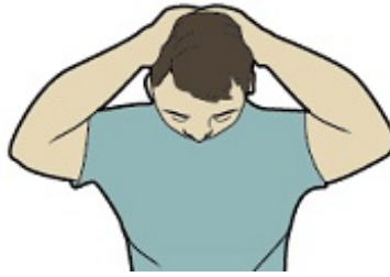
Figura 1. Estiramiento del cuello hacia delante