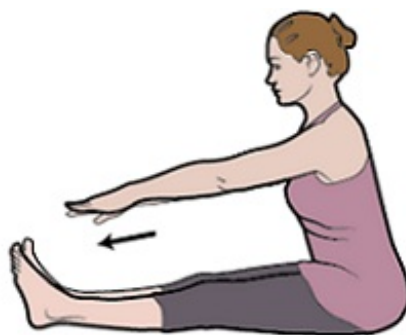
Figura 7. Estiramiento de ligamento de la corva