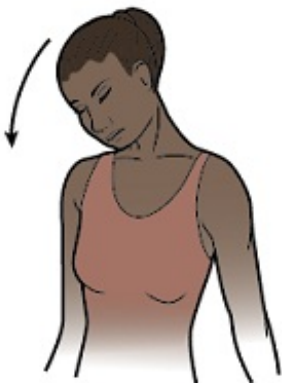
Figura 2. Baje la oreja hacia el hombro