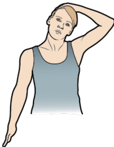
Figura 5. Estiramiento del costado del cuello