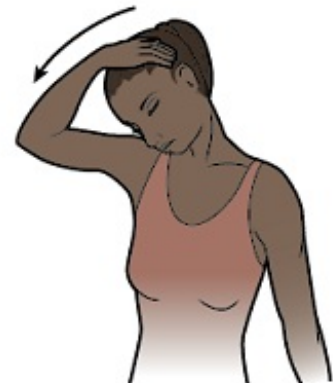
Figura 4. Presione el mentón contra el pecho