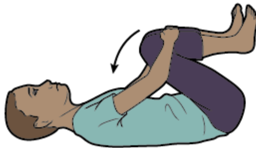
Figura 6. Estiramiento de la rodilla al pecho