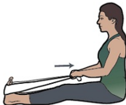
Figura 8. Estiramiento de pantorrilla en posición sentada