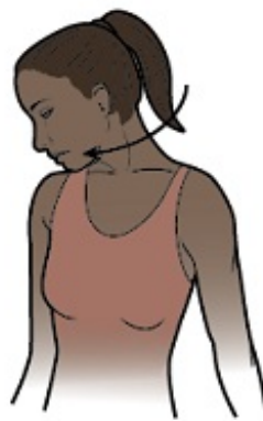
Figura 3. Mueva la cabeza de modo que la nariz apunte hacia la axila