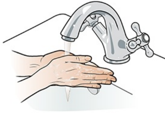
Figura 1. Lávese las manos con agua y jabón