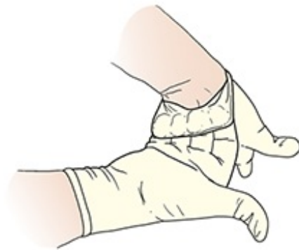
Figura 7. Deslice el puño sobre la muñeca