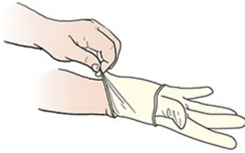
Figura 4. Coloque la mano dentro del guante y deslice el puño sobre la muñeca