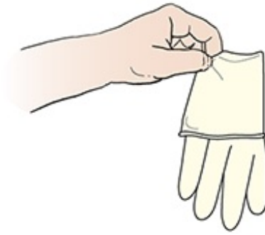
Figura 3. Levante el primer guante