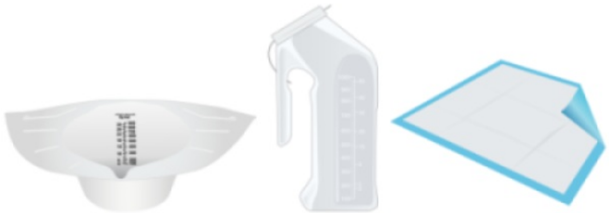
Figura 1. Recipiente sombrero para la orina (izquierda), orinal (centro) y almohadilla (derecha)

Si necesita más de estos materiales, puede comprarlos en su farmacia local.