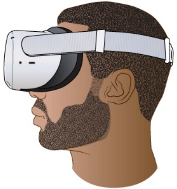
Figura 1. Usando un equipo de realidad virtual

Los controladores tienen botones que le permiten tocar, levantar y mover cosas en la realidad virtual (véase la figura 3). También tienen sensores. Cuando sostenga los controles y mueva las manos, también verá que las manos se mueven en la realidad virtual.