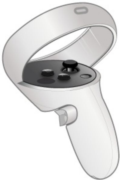
Figura 3. Botones del controlador de realidad virtual