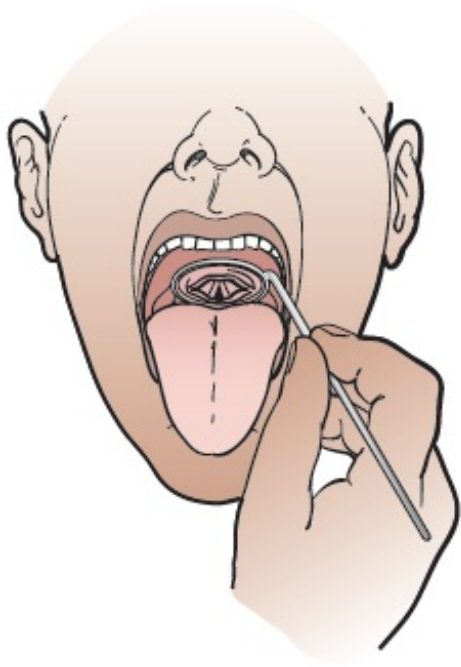
Figura 2. Revisión de las cuerdas vocales

Las cuerdas vocales son importantes para respirar, toser, emitir sonidos y para la deglución.