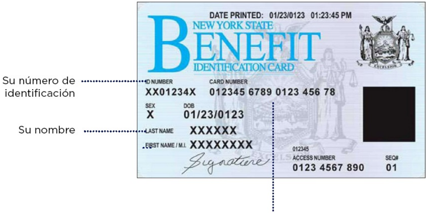
Figura 4. Información que se encuentra en su tarjeta de beneficios de Medicaid del estado de New York.

Llame al número de Servicios para Miembros que se encuentra en el reverso de cualquier tarjeta de seguro para hacer preguntas sobre sus beneficios y su plan de seguro. Es posible que tenga preguntas sobre las facturas que recibe por correo o que necesite ayuda para encontrar un proveedor de atención médica. Servicios para Miembros puede ayudar. Sus tarjetas de seguro del estado de New York y toda la documentación estarán en inglés.