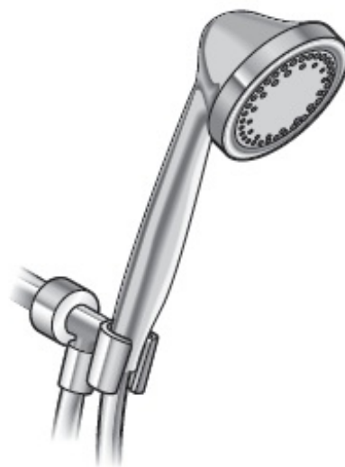
Figure 1. Douchette à main

L'utilisation d'une douchette peut limiter les risques de chute. Elle permet d'entrer dans la douche ou la baignoire vide, puis d'ouvrir l'eau une fois à l'intérieur.