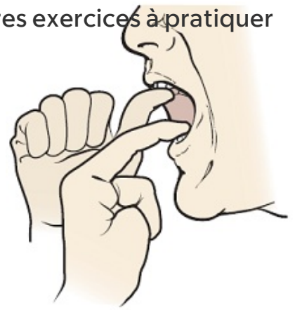
Figure 5. Utilisez vos doigts pour exercer plus de force.

Votre équipe soignante vous indiquera ce qu'il est préférable de manger et boire durant votre traitement. Votre ORL vous recommandera des aliments et des liquides appropriés, avec la consistance adaptée à votre cas. Lorsque vous essayez de nouveaux aliments (solides ou liquides), veillez à ce que leur consistance réponde aux recommandations de votre spécialiste.