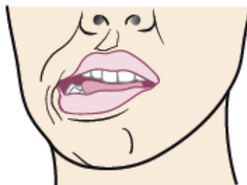
Figure 4. Déplacez votre mâchoire vers la droite.