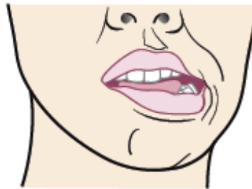
Figure 3. Déplacez votre mâchoire vers la gauche.