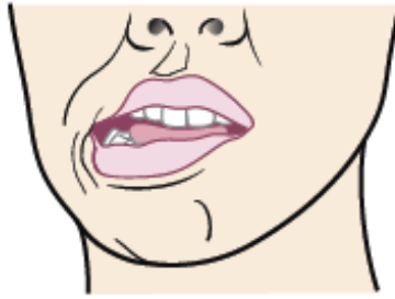
Figure 4. Déplacez votre mâchoire vers la droite.