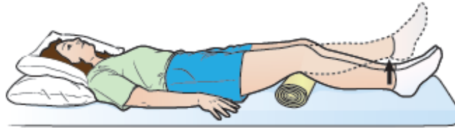
Imaj 2. Egzèsis pou misk nan pati anlè kuis