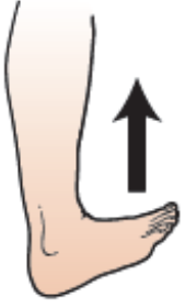
Imaj 13. Fason pou mete pwent zòtèy ou anlè