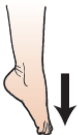
Imaj 14. Fason pou mete pwent zòtèy ou atè