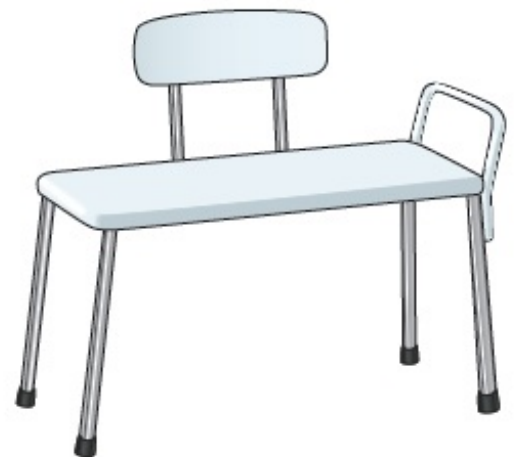
Figura 5. Panca di trasferimento per vasca

Una panca di trasferimento per vasca è un sedile utilizzato per aiutarti a entrare e uscire dalla doccia o dalla vasca da bagno. È utile per le persone che hanno difficoltà a sollevare le gambe per entrare e uscire dalla vasca. La panca dispone di gommini o ventose sul fondo di ogni gamba (vedi Figura 5). Questi le impediscono di muoversi nella vasca, consentendoti di muoverti in modo semplice e sicuro.