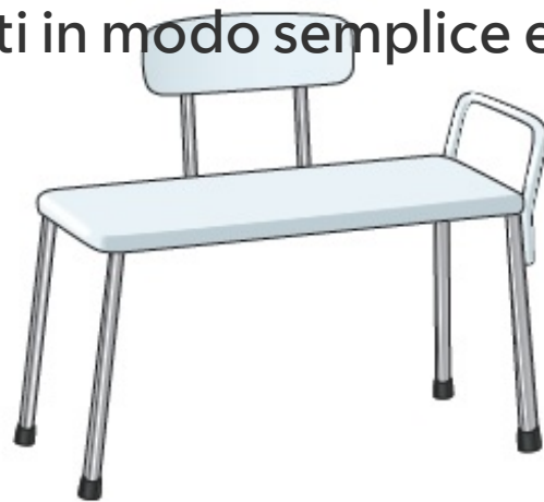
Figura 5. Panca di trasferimento per vasca

Posiziona 2 gambe della panca di trasferimento all'interno della vasca. Le altre 2 gambe lasciale all'esterno della vasca (vedi Figura 6). Posiziona la panca in modo che più della metà sia all'interno della vasca. Controlla che ogni gamba sia saldamente fissata e che la panca non scivoli. Assicurati di lasciare abbastanza spazio per le tue gambe davanti alla panca.