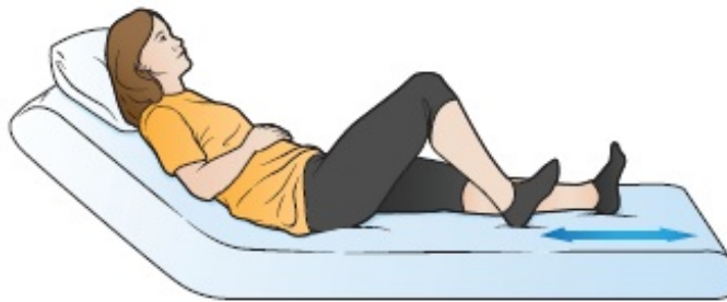
Figura 1. Scivolamento dei talloni