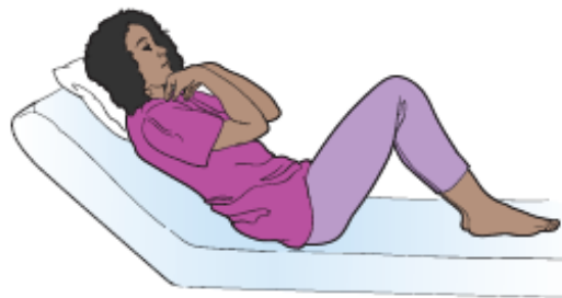
Figura 9. Tocco delle spalle