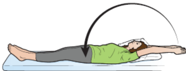
Figura 11. Allungamento delle braccia