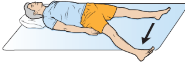
Figura 5. Rafforzamento degli adduttori