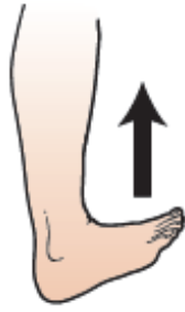
Figura 13. Dita verso l'alto