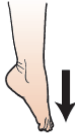
Figura 14. Dita verso il basso