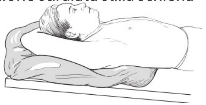
Figura 1. Posizionamento nello stampo

Mentre sei sul lettino, verrà realizzato uno stampo del busto. I radioterapisti verseranno un fluido tiepido in un largo sacco di plastica che sarà chiuso e posizionato sul lettino. Ti stenderai sul sacco, sulla schiena, con le