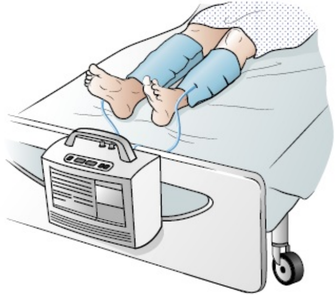
그림 3. 다리의 SCD 슬리브

SCD는 다리 아래쪽을 감싸는 슬리브입니다(그림 3 참조). 슬리브가 튜브에 의해 기계에 연결되며, 이 기계는 공기를 슬리브로 넣고 빼는 방식으로 다리를 부드럽게 조입니다. 이는 혈액 순환을 도와 혈병을 예방할 수 있는 안전하고 효과적인 방법입니다.