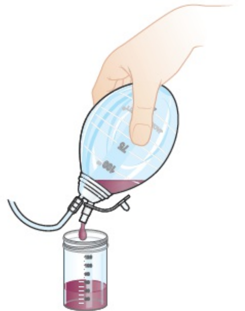
그림 2. 밸브 비우기