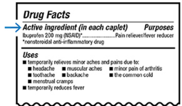
그림 1. 일반의약품 라벨에 적혀 있는 유효 성분

라벨은 이용하는 약국에 따라 모양이 다른 경우가 많습니다. 다음 예시에서는 MSK의 약국 라벨에서 약의 유효 성분(제네릭명)을 찾을 수 있는 위치를 보여 줍니다(그림 2 참조).