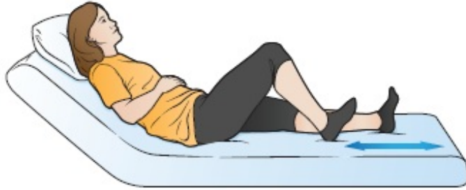
그림 1. 발뒤꿈치 밀고 당기기