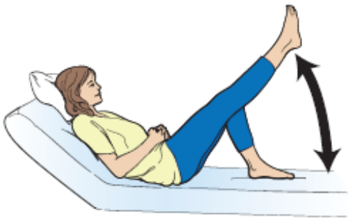
그림 7. 다리 들어 올리기