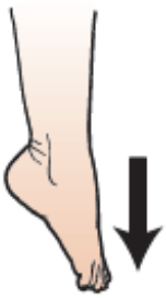
그림 14. 발가락 아래로 내리기