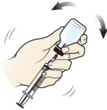
그림 4. 글루카곤 분말과 액체 혼합

용액은 색이 없고 투명합니다. 혼합 중 거품이 보일 수도 있습니다. 이는 정상적인 현상입니다. 용액이 흐리거나 혼합 후 사라지지 않은 고체 입자가 보이면 약물을 사용하지 마십시오. 이 경우 즉시 911로 전화하십시오.