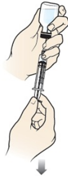
그림 5. 글루카곤 혼합물로 시린지 채우기

시린지 플런저를 당겨서 바이알의 모든 약물로 시린지를 채웁니다. 시린지 상단에 공기가 있으면 천천히 플런저를 눌러서 공기를 제거합니다.