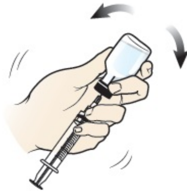
그림 4. 글루카곤 분말과 액체 혼합

용액은 색이 없고 투명합니다. 혼합 중 거품이 보일 수도 있습니다. 이는 정상적인 현상입니다. 용액이 흐리거나 혼합 후 사라지지 않은 고체 입자가 보이면 약물을 사용하지 마십시오. 이 경우 즉시 911로 전화하십시오.