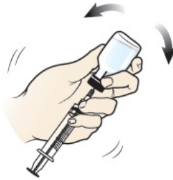
그림 4. 글루카곤 분말과 액체 혼합

용액은 색이 없고 투명합니다. 혼합 중 거품이 보일 수도 있습니다. 이는 정상적인 현상입니다. 용액이 흐리거나 혼합 후 사라지지 않은 고체 입자가 보이면 약물을 사용하지 마십시오. 이 경우 즉시 911로 전화하십시오.