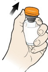
그림 2. 플라스틱 캡 제거