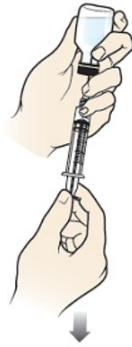
그림 5. 글루카곤 혼합물로 시린지 채우기