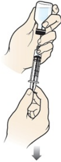
그림 5. 글루카곤 혼합물로 시린지 채우기

시린지 플런저를 당겨서 바이알의 모든 약물로 시린지를 채웁니다. 시린지 상단에 공기가 있으면 천천히 플런저를 눌러서 공기를 제거합니다.