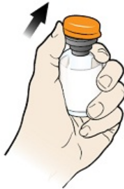
그림 2. 플라스틱 캡 제거