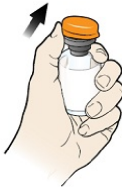
그림 2. 플라스틱 캡 제거