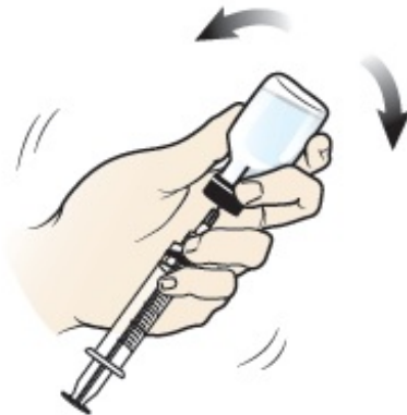
그림 4. 글루카곤 분말과 액체 혼합

용액은 색이 없고 투명합니다. 혼합 중 거품이 보일 수도 있습니다. 이는 정상적인 현상입니다. 용액이 흐리거나 혼합 후 사라지지 않은 고체 입자가 보이면 약물을 사용하지 마십시오. 이 경우 즉시 911로 전화하십시오.