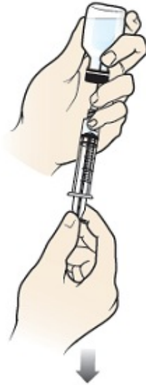
그림 5. 글루카곤 혼합물로 시린지 채우기

시린지 플런저를 당겨서 바이알의 모든 약물로 시린지를 채웁니다. 시린지 상단에 공기가 있으면 천천히 플런저를 눌러서 공기를 제거합니다.