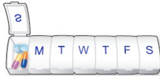
그림 2. 알약 상자의 예

대부분의 알약 상자는 어린이 안전 장치가 달려 있지 않습니다. 집에 자녀가 있는 경우 알약 상자를 자녀의 손이 닿지 않는 곳에 보관하십시오.