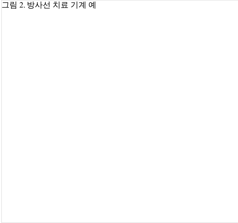
그림 2. 방사선 치료 기계 예

치료 계획에 따라 15-90분 가량 치료실에 머무르게 됩니다. 이 시간 대부분은 정확한 위치를 잡는 데 보내게 됩니다. 방사선 치료사가 치료실에 들어왔다 나갔다 하지만, 항상 귀하를 지켜 보고 귀하의 말을 듣고 있습니다.