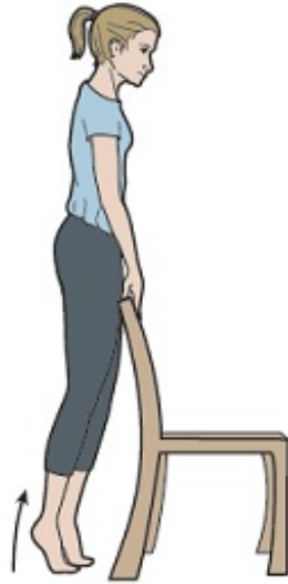
그림 6. 발뒤꿈치 올리기