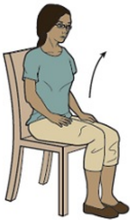
Rysunek 4. Siedzenie na krześle