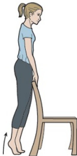
Rysunek 6. Unoszenie pięt