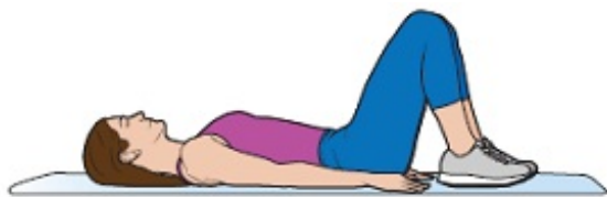
Rysunek 7. Leżenie na plecach ze zgiętymi kolanami