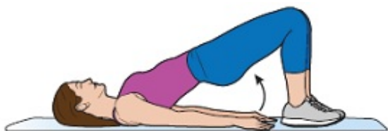
Rysunek 8. Unoszenie pośladków