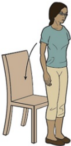
Rysunek 5. Wstawanie