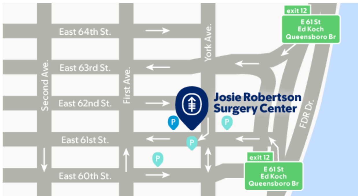
Rysunek 1. Parkign MSK (niebieski) i inne pobliskie parkingi (zielononiebieskie)