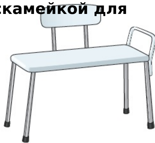
Рисунок 5. Переходная скамейка для ванны

Поставьте 2 ножки переходной скамейки в ванну. Поставьте 2 другие ножки скамейки за пределами ванны (см. рисунок 6). При этом чуть больше половины скамейки должно быть в ванне. Проверьте, зафиксированы ли все ножки так, чтобы скамейка не скользила. Обязательно оставьте перед скамейкой достаточно места для ног.