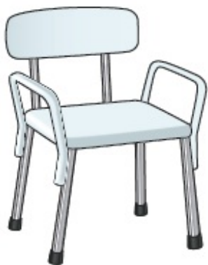
Рисунок 2. Стул для душа с подлокотниками и спинкой