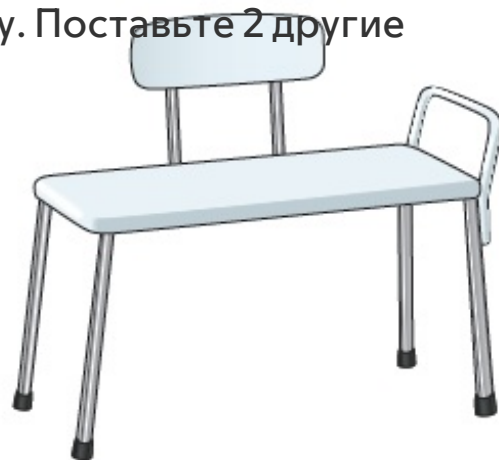
Рисунок 5. Переходная скамейка для ванны

Поставьте 2 ножки переходной скамейки в ванну. Поставьте 2 другие ножки скамейки за пределами ванны (см. рисунок 6). При этом чуть больше половины скамейки должно быть в ванне. Проверьте, зафиксированы ли все ножки так, чтобы скамейка не скользила. Обязательно оставьте перед скамейкой достаточно места для ног.