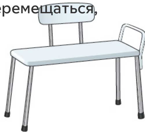
Рисунок 5. Переносная скамья для ванны

При этом чуть больше половины скамьи должно быть в ванне. Проверьте, зафиксированы ли все ножки так, чтобы скамья не скользила. Оставьте перед скамьей достаточно места для ног.