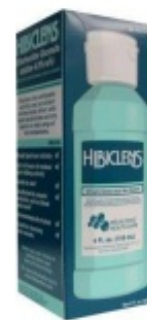
Средство для очищения кожи Hibiclens

Hibiclens — это средство для очищения кожи, которое убивает микроорганизмы и предотвращает их появление в течение суток после использования (см. рисунок). Принятие душа с Hibiclens до операции помогает снизить риск развития инфекции после операции. Вы можете приобрести Hibiclens в вашей ближайшей аптеке без рецепта.