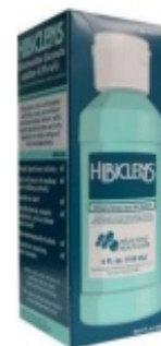
Средство для очищения кожи Hibiclens