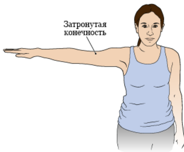
Рисунок 2. Рука, поднятая на 90 градусов

градусов, что представляет собой высоту плеч (см. рисунок 2). Вы можете распрямить локоть, но не поднимайте руку выше этого положения.