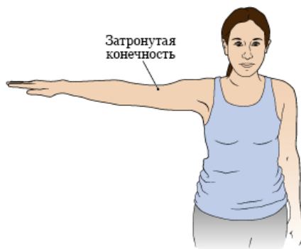
Рисунок 2. Рука, поднятая на 90 градусов