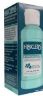
Рисунок 1. Средство для очистки кожи Hibiclens

появление в течение суток после использования (см. рисунок 1). Приняв душ с Hibiclens перед операцией, вы снизите риск инфицирования после операции. Вы можете приобрести Hibiclens в вашей ближайшей аптеке без рецепта.