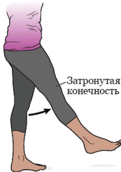
Рисунок 2. Сгибание бедра