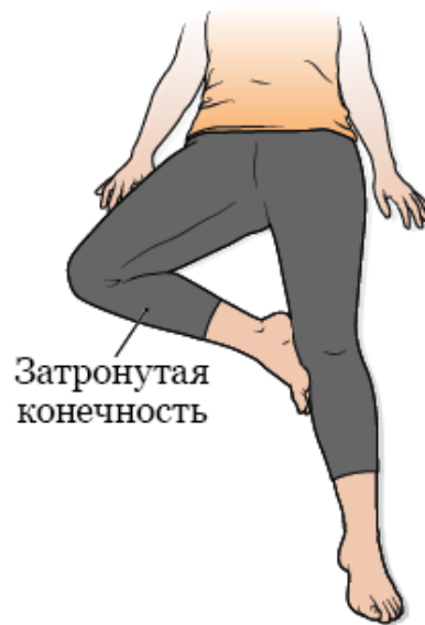
Рисунок 1. Положение «лягушачья лапка»