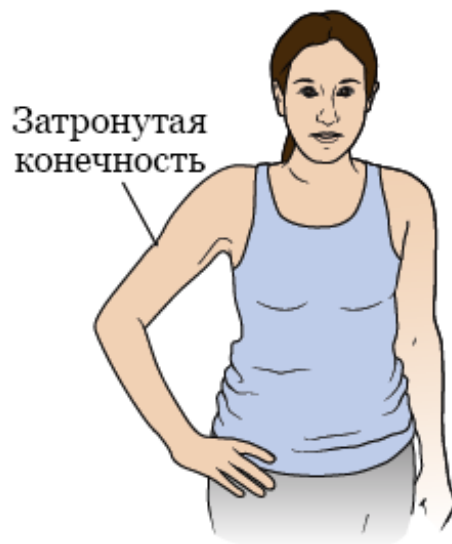
Рисунок 3. Расстояние между рукой и туловищем