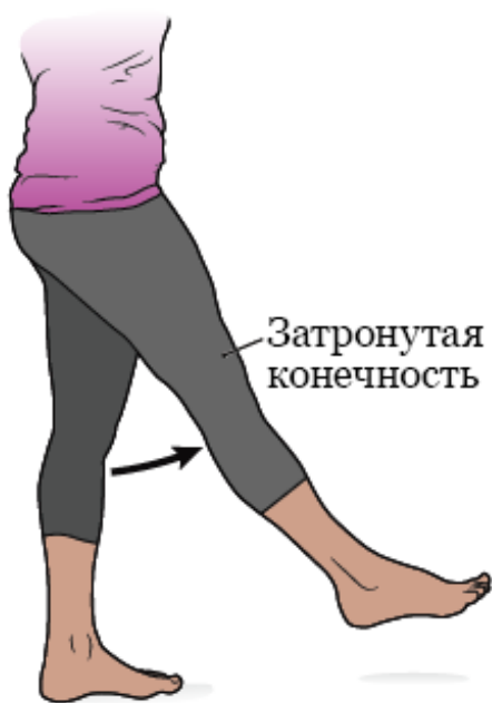
Рисунок 2. Сгибание бедра