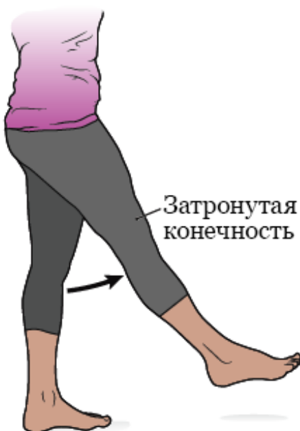
Рисунок 1. Положение «лягушачья лапка»