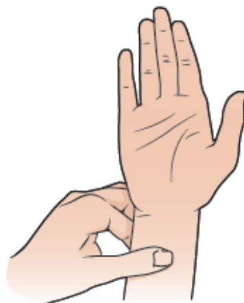
Рисунок 2. Как прижать большой палец к точке под указательным пальцем