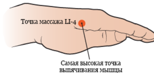
Рисунок 3. Поиск самой высокой точки выпуклости