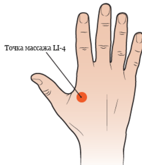
Рисунок 1. Точка массажа LI-4 на тыльной стороне ладони