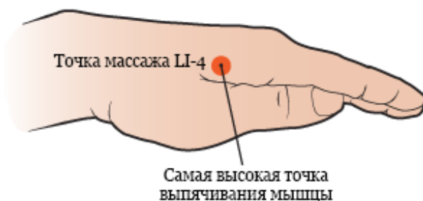
Рисунок 3. Поиск самой высокой точки выпуклости