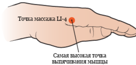
Рисунок 3. Поиск самой высокой точки выпуклости