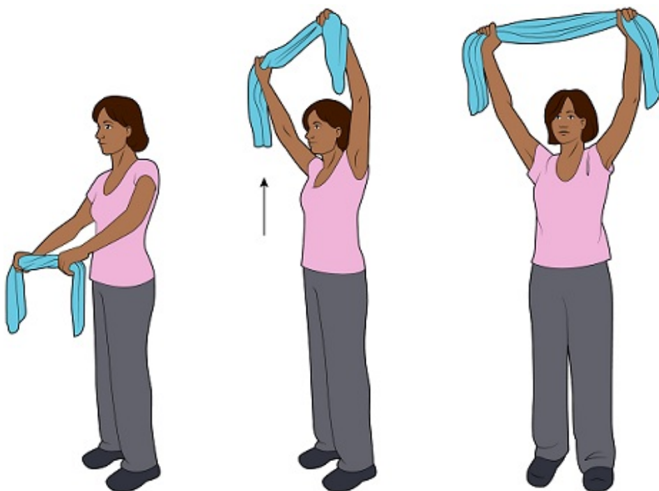
Рисунок 3. Растяжка с поднятием рук вверх