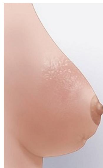
Рисунок 2. Покраснение и втяжение на молочной железе