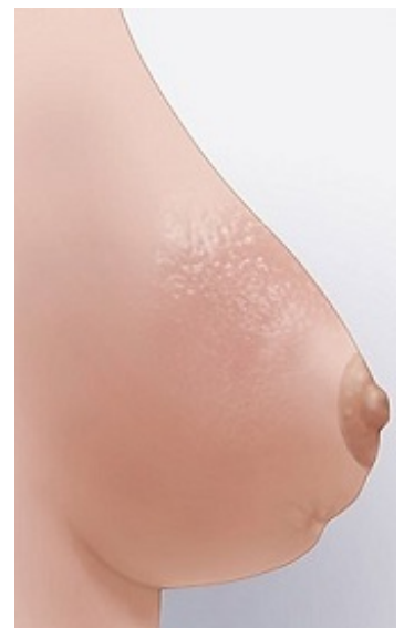
Рисунок 2. Покраснение и втяжение на молочной железе

3. Немного поднимите одну руку и осмотрите область подмышки. Прощупайте подмышечную впадину на наличие изменений или уплотнений. Сделайте то же самое в другой подмышечной впадине. Не поднимайте руку прямо вверх — из-за этого ткани в этой зоне натянутся, и их будет труднее обследовать.