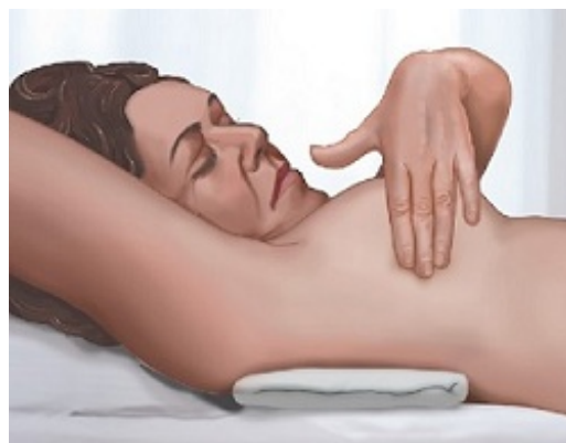
Рисунок 4. Самообследование молочной железы в положении лежа

Вам необходимо будет варьировать силу надавливания в пределах 3 уровней. При прощупывании тканей молочной железы применяйте все 3 уровня силы надавливания в каждой точке, прежде чем переходить к следующей. Если вы не уверены, с какой силой следует надавливать, проконсультируйтесь со