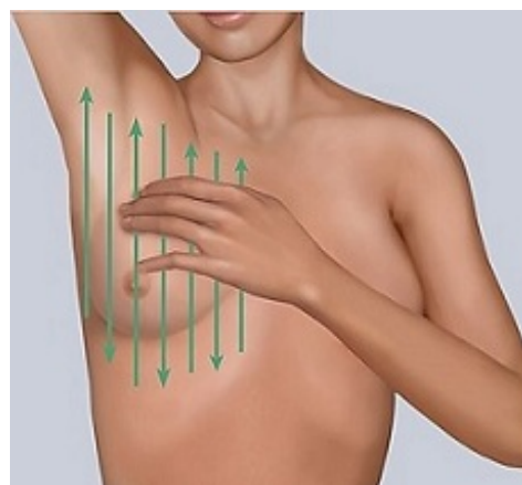
Рисунок 5. Использование вертикальной схемы для обследования груди

3. Затем обследуйте всю молочную железу по восходяще-нисходящей схеме, которую иногда называют вертикальной схемой (см. рисунок 5). Начните в области подмышки и понемногу перемещайте пальцы вниз, пока не дойдете до низа грудной клетки. Затем переместите пальцы немного ближе к центру и двигайтесь вверх, пока не дойдете до ключицы. Продолжайте передвигаться по этой схеме, обследуя всю молочную железу до самой середины грудины (также известной как грудная или грудинная кость).