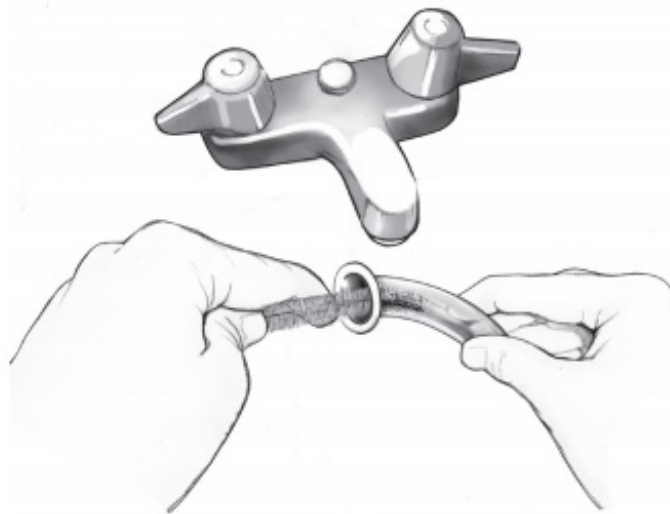
Рисунок 2. Очистка ларингэктомической трубки