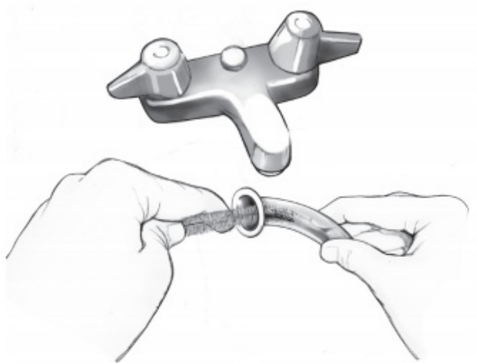
Рисунок 2. Очистка ларингэктомической трубки