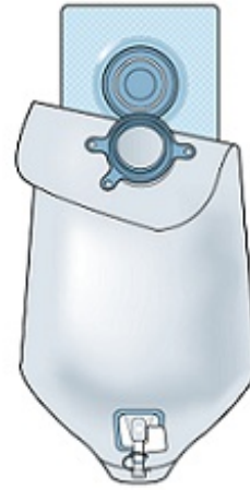
Рисунок 2. Присоединение стомного мешка к клеевой пластине