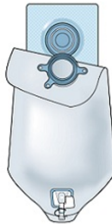
Рисунок 2. Присоединение стомного мешка к клеевой пластине